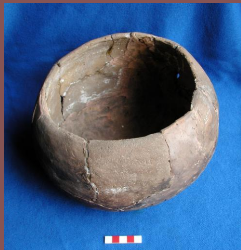
Pieza 2.827. Olla cerámica