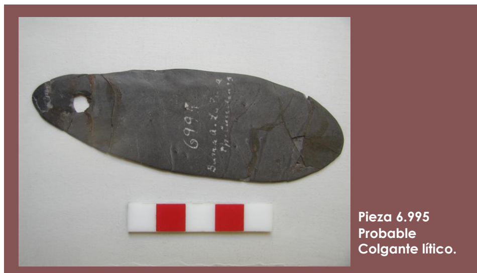
Pieza 6.995 Probable Colgante lítico.