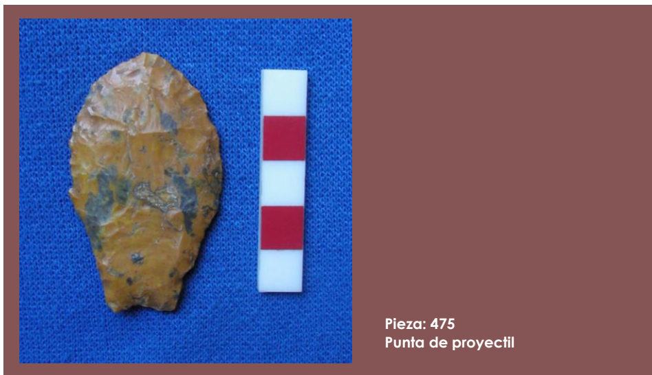
Pieza: 475 Punta de proyectil