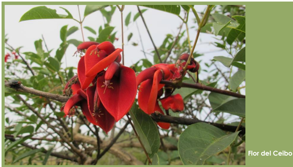
Flor del Ceibo.