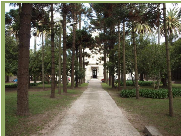
Avenida de las Araucarias. Ingreso al museo por la Avda. de las Instrucciones.