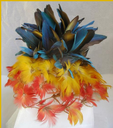
Pieza: E 402 Cofia.