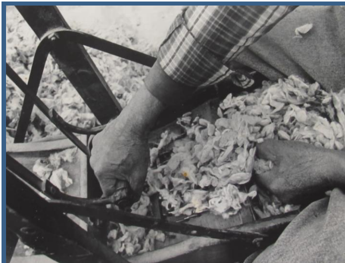
Investigación: Oficios Tradicionales.