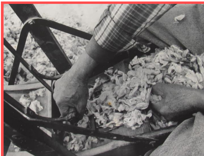
Fotografía perteneciente al acervo del Museo Nacional de Antropología. Investigación: Oficios Tradicionales. Investigadora: Leticia Cannella. Fotografía: Oscar Bonilla