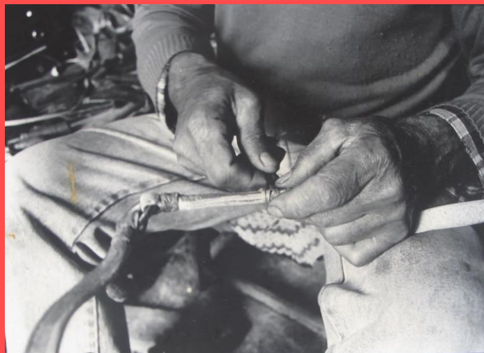
Fotografía perteneciente al acervo del Museo Nacional de Antropología. Investigación: Oficios Tradicionales. Investigadora: Leticia Cannella. Fotografía: Oscar Bonilla.