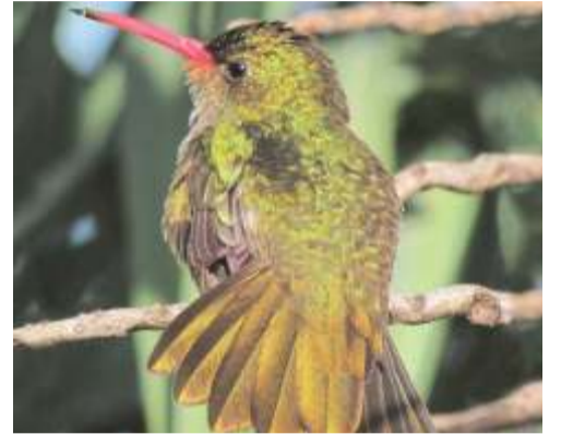
Picaflor bronceado ( Hylocharis chrysura )