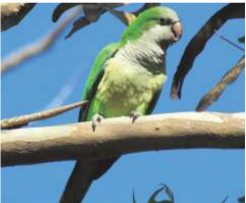
Cotorra común ( Myiopsitta monachus )