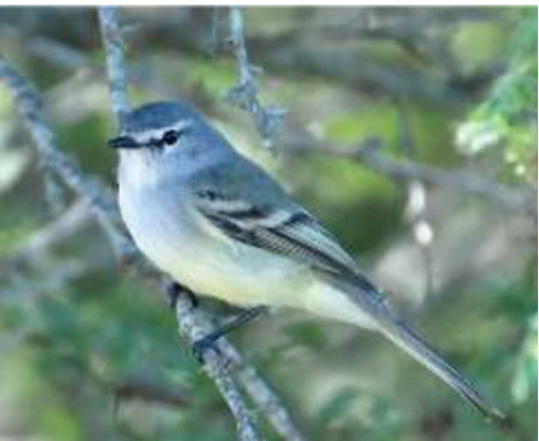
Tiqui tiqui ( Serpophaga subcristata )