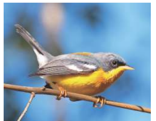
Pitiaquí ( Parula pitiaquí )