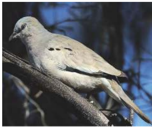
Torcacita común ( Columbina picui )