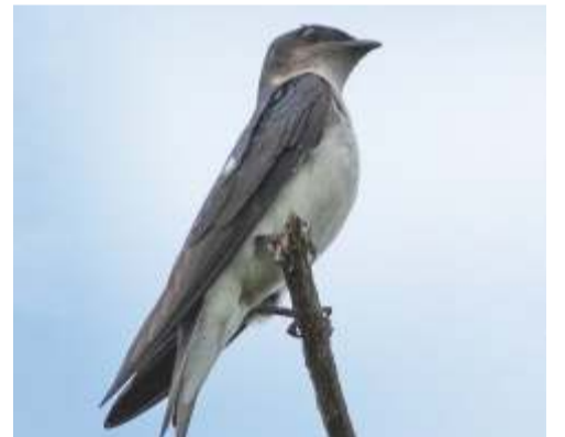
Golondrina azul grande ( Progne chalybea )