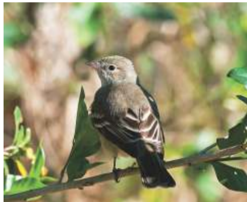
Fiofio pico corto ( Elaenia parvirostris )