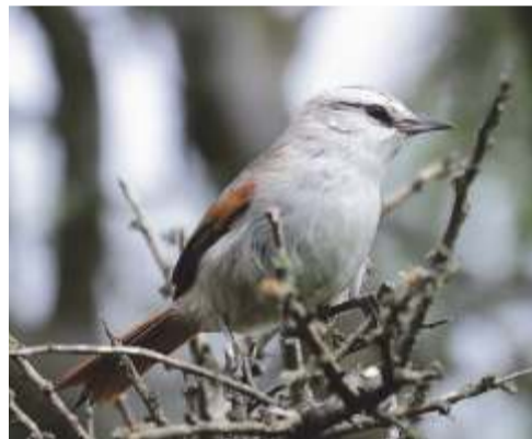
Trepadorcito común ( Cranioleuca pyrrhophia )