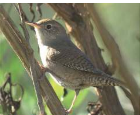
Ratonera ( Troglodytes aedon )