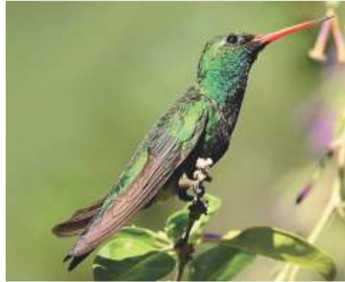
Picaflor verde ( Chlorostilbon lucidus )