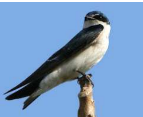
Golondrina cejas blancas ( Tachycineta leucorrhoa )