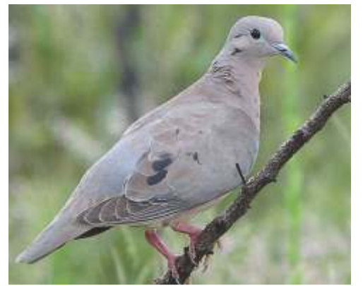
Torcaza ( Zenaida auriculata )