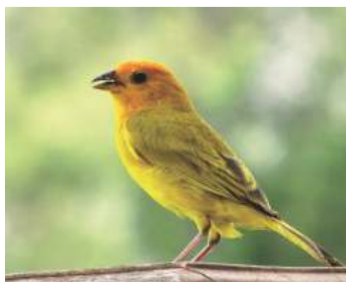
Dorado ( Sicalis flaveola )