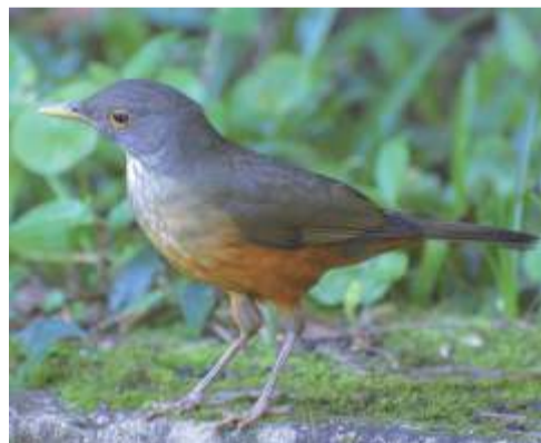
Zorzal ( Turdus rufiventris )