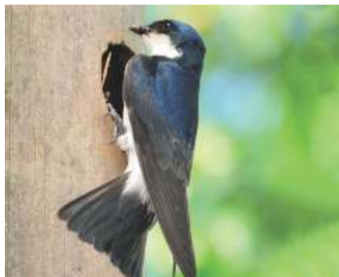
Golondrina azul chica ( Pygochelidon cyanoleuca )