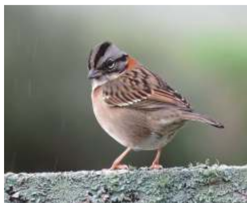
Chingolo ( Zonotrichia capensis )