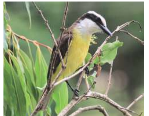
Benteveo ( Pitangus sulphuratus )