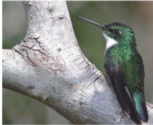
Picaflor garganta blanca ( Leucochloris albicollis )