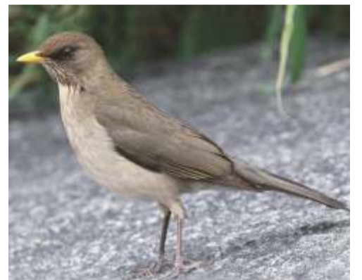
Sabiá ( Turdus amaurochalinus )