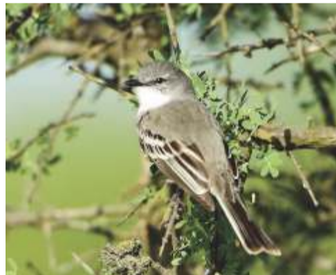
Suirirí común ( Suiriri suiriri )