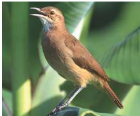
Hornero ( Furnarius rufus )