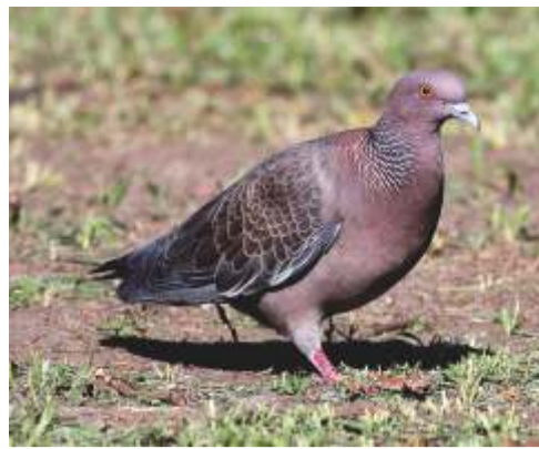
Paloma de monte ( Patagioenas picazuro )