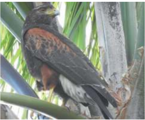
Gavilán mixto ( Parabuteo unicinctus )