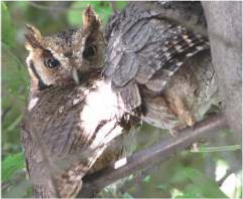
Tamborcito común ( Megascops choliba )