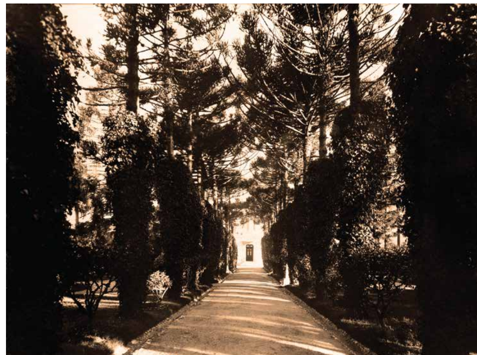
Fotografía del Álbum Familiar de 1925

“Su aspecto es, pues, el resultado de un perpetuo equilibrio entre el movimiento cíclico de las estaciones, del desarrollo y el deterioro de la naturaleza, y de la voluntad artística y de artificio que tiende a perpetuar su estado”.