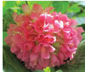
Árbol de las Hortensias (Dombeya)