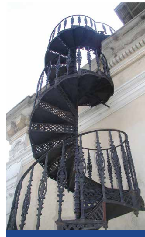
Escalera de hierro que conduce al Mirador.