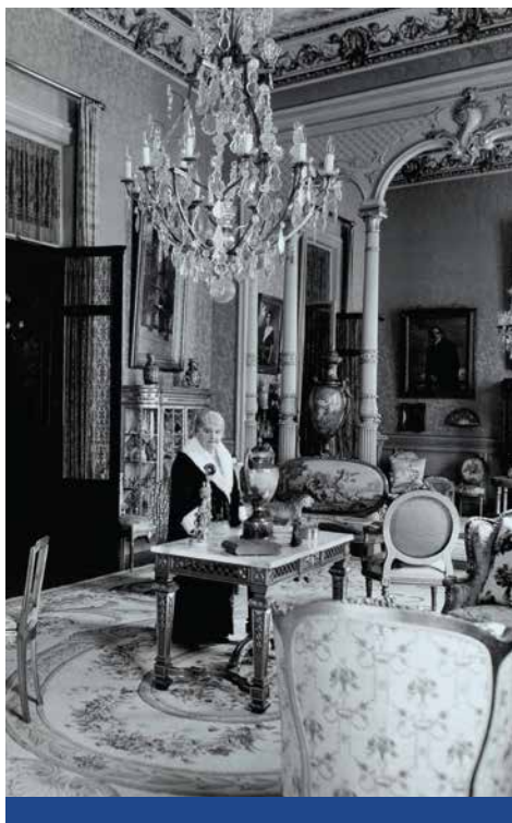
Sala de música original de la casa. Actualmente, Sala de Actos del Museo.

En el año 1979, el Ministerio autoriza la instalación en dicha finca, de las colecciones arqueológicas, geológicas y paleontológicas donadas por el Prof. Francisco Oliveras. En base a esta donación, en 1981 se crea el Museo Nacional de Antropología, que abre sus puertas al público en 1988.