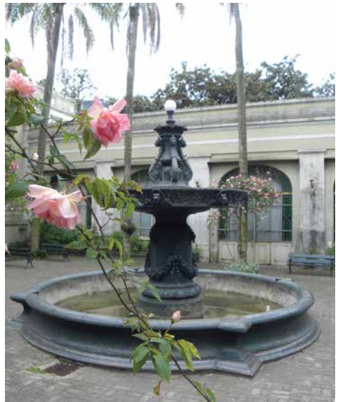
Fuente del patio interior.

Interiormente debe señalarse el desarrollo de las ventanas con vidrios coloreados que rodea el patio y muy especialmente las terminaciones, tanto a nivel de los pisos como del revestimiento de los muros, la pintura de cielorrasos, la carpintería y la herrería. Asimismo, se destacan las escaleras-caracol, la primera en madera que conduce a la planta alta, y la segunda en hierro al mirador.