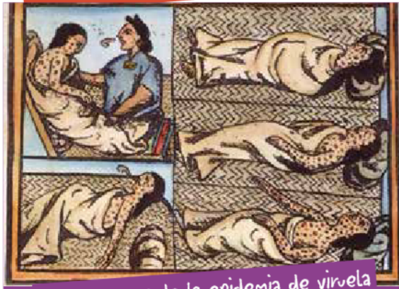
1520: escenas de la epidemia de viruela entre los pueblos indígenas americanos.

¿Sabías que la humanidad ha pasado por pandemias de viruela, difteria, gripe, tuberculosis, fiebre amarilla, fiebre tifoidea, cólera y peste negra, entre otras?