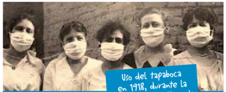
Uso del tapaboca en 1918, durante la epidemia de la llamada "gripe española".

El virus de la viruela necesita de los humanos para persistir y de un contacto directo para el contagio. Se desconoce su origen, ¡pero se han encontrado restos del virus en momias egipcias del siglo III A.C.! En la conquista de América este virus provocó estragos en los pueblos americanos originarios porque no tenían inmunidad para estas enfermedades.