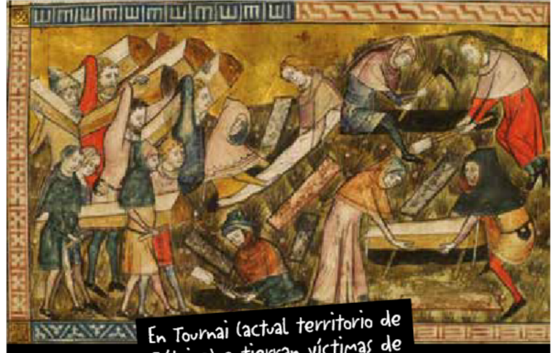
En Tournai (actual territorio de Bélgica) entierran víctimas de la peste negra. Pintura de 1353.

Ocurrió a mediados del siglo XIV en Asia y Europa debido a la transmisión de una bacteria que propagó la llamada rata negra ( Rattus rattus ). Se la considera la mayor pandemia sufrida por la humanidad.