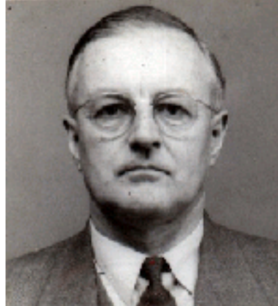
Retrato sin fecha (izquierda) y de 1943 (derecha)